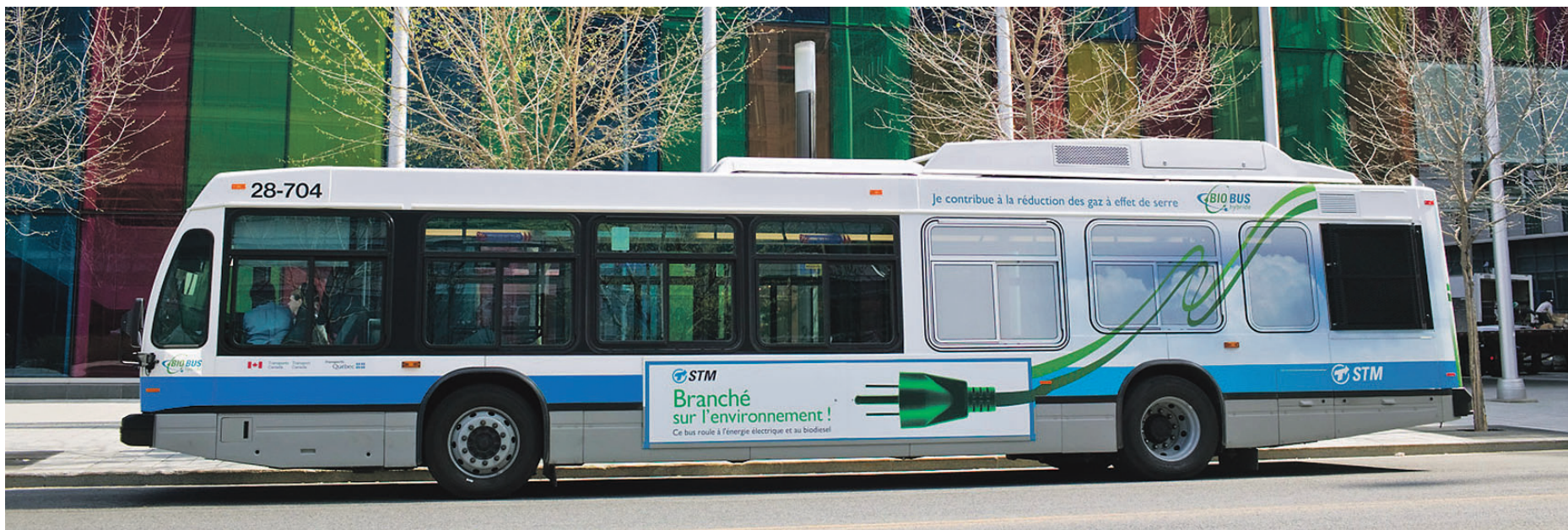
Bus hybride

La STM fait l'essai de huit autobus à propulsion hybride biodiesel-électrique dans les rues de Montréal. Ils sont faciles à repérer, maquillés d'une prise électrique verte sur le côté.